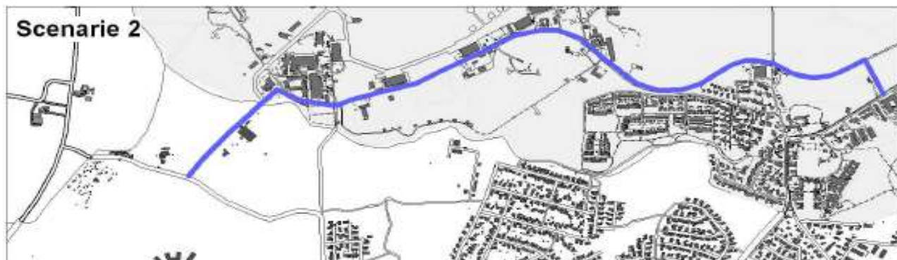
Fra Figur 6 i Trafikale Vurderinger, 2008

Denne vejadgang til Perimetervej blev i en trafikal vurdering fra 2008 foretaget af Rambøll for Furesø Kommune i Figur 6 beskrevet som Scenarie 2 ud af 4 scenarier: